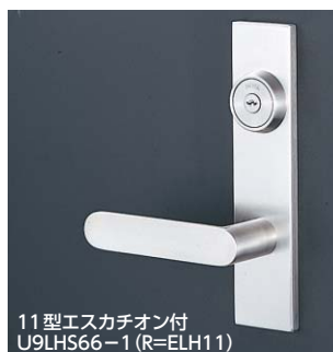
11型エスカチオン付 U9LHS66-1 (R=ELH11)