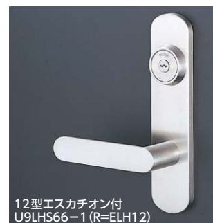
12型エスカチオン付 U9LHS66-1 (R=ELH12)